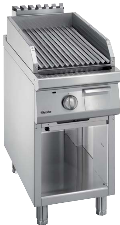
Füllmenge Lavasteine 6 kg