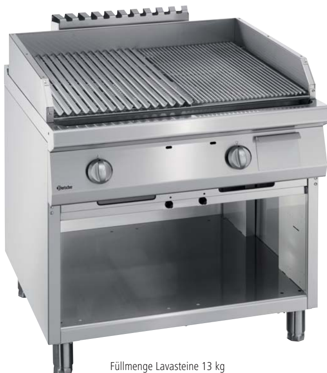
Füllmenge Lavasteine 13 kg