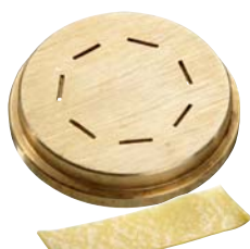
Fettuccine 8 mm Gewicht: 0,153 kg GTIN (EAN) 4015613584959 | Art.-Nr. 101982 | Euro 55,-