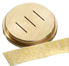
Pappardelle 16 mm Gewicht: 0,165 kg GTIN (EAN) 4015613584874 | Art.-Nr. 101974 | Euro 55,-