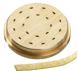
Tagliolini 3 mm Gewicht: 0,153 kg GTIN (EAN) 4015613584942 | Art.-Nr. 101981 | Euro 55,-