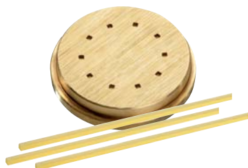
Spaghetti alla chitarra 2 x 2 mm Gewicht: 0,171 kg GTIN (EAN) 4015613584935 | Art.-Nr. 101980 | Euro 55,-