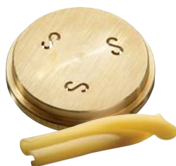
Caserecce 9 x 5 mm Gewicht: 0,150 kg GTIN (EAN) 4015613584850 | Art.-Nr. 101972 | Euro 55,-