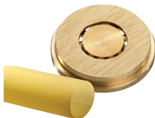
Cannelloni Ø 25 mm Gewicht: 0,151 kg GTIN (EAN) 4015613584973 | Art.-Nr. 101984 | Euro 55,-