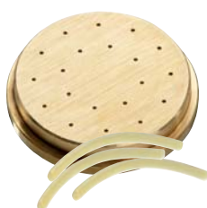
Capelli d'angelo Ø 1 mm Gewicht: 0,167 kg GTIN (EAN) 4015613584911 | Art.-Nr. 101978 | Euro 55,-