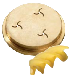
Fusilli Ø 9 mm Gewicht: 0,144 kg GTIN (EAN) 4015613584867 | Art.-Nr. 101973 | Euro 55,-