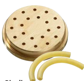
Bigoli Ø 3 mm Gewicht: 0,165 kg GTIN (EAN) 4015613584980 | Art.-Nr. 101985 | Euro 55,-