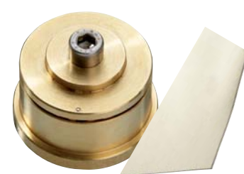
Pasta sfoglia 135 mm Gewicht: 0,414 kg GTIN (EAN) 4015613584966 | Art.-Nr. 101983 | Euro 75,-