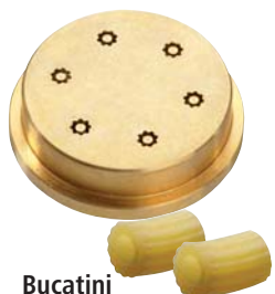
Bucatini Ø 4 mm Gewicht: 0,236 kg GTIN (EAN) 4015613584898 | Art.-Nr. 101976 | Euro 55,-