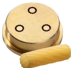
Maccheroni Ø 8,5 mm Gewicht: 0,276 kg GTIN (EAN) 4015613584904 | Art.-Nr. 101977 | Euro 55,-