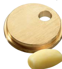
Gnocchi Ø 12 mm Gewicht: 0,170 kg GTIN (EAN) 4015613584881 | Art.-Nr. 101975 | Euro 55,-